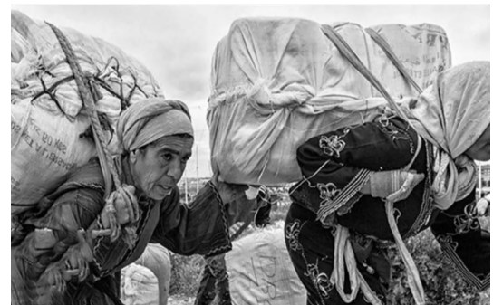
كۆلبەريى، پەلەيەكى رەشە بە ناوچاوانى كۆمارى ئيسلامىيەو