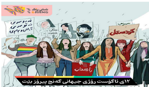
لاوانى ئيران، ھەم رەنج و بيبەشى، ھەم خەبات و خۆراگري