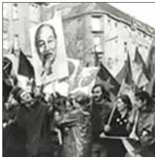
پرچم‌های ویتنام و تصویر هوشی مین در دست دانشجویان آلمان

می گرفت. و هر چند خواست خروج ارتش آمریکا از ویتنام یکی از شعارها بود، ولی برای چپ انقلابی و اس.د.اس که در مرکز و رهبری مبارزات ضد جنگ بودند، مسئله اصلی برقراری صلح نبود. از نظر آن‌ها ویتنام تنها یک مبارزه استقلال طلبانه برحق نبود، بلکه نوک پیکان مبارزه جاری جهانی علیه امپریالیسم و سرمایه‌داری بود، مبارزه‌ای که نیروهای انقلابی آلمان خود را بخشی از آن می‌دیدند.