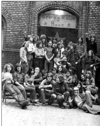
مرکز گئورگ فن رائوخ

ولی سیاست «اول شلیک بعدا سوال» ادامه داشت. پلیس جوان هفده ساله‌ای را به مسلسل بست و سوراخ سوراخ کرد چون ایست پلیس را ندیده گرفته بود. بعدا معلوم شد که فرار این جوان به این خاطر بوده که بدون گواهینامه رانندگی می‌کرده است. یک بازرگان اسکاتلندی که (ارتباطی با راف نداشت) در حالی که در خانه‌اش در اشتوتگارت حمام می‌کرد توسط آتش پلیس که به خانه‌اش حمله کرده بود به قتل رسید.