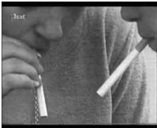
صحنه ای از فیلم بامبوله