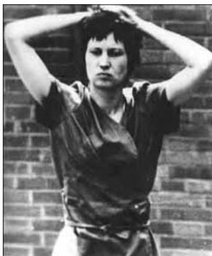
اولریکه در زندان

«هرکس زندگی اش را دوست دارد، بهتر است اول به زنان شلیک کند. من به تجربه دیده ام که زنان تروریست شخصیت‌هایی به مراتب قوی‌تر دارند و از قدرت و انرژی بیشتری برخوردارند. نمونه‌های بسیاری بوده که مردان قبل از تیراندازی لحظه‌ای تامل کرده‌اند ولی زنان فوراً شلیک می‌کنند. این در میان تروریست‌ها یک پدیده عمومی است.» — کریستیان لوخته*، مدیر شبکه جمع آوری اطلاعات ضدخرابکاری آلمان.