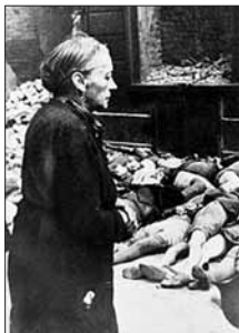
تل جسدها متعاقب بمباران یک مدرسه در شهر برانشویگ

ولی اعتراضات مردم جنگ زدهٔ اروپا به آلمان محدود نمی‌شد. اعتصاب و ناآرامی چند کشور اروپا را در بر می‌گرفت. صفوف احزاب کمونیست که در ایتالیا و فرانسه رهبری و بدنه اصلی مقاومت پارتیزانی ضد فاشیسم را تشکیل داده بودند، گسترده می‌شد. ۳ کمونیست‌ها در یونان به کسب قدرت نزدیک می‌شدند.