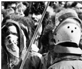
تصاویری از تشییع جنازه اولریکه

اختلافات حاد می‌شد. و دوره‌ای بود که اختلاف بین انسلین و اولریکه شدید بود. دولت با استناد به برخی نامه‌های پراکنده و بدون تاریخ می‌خواست این اختلافات را دلیل خودکشی اولریکه معرفی کند. ولی علاوه بر شواهد فیزیکی، شواهدی دیگری نیز حاکی از آن بود که این اختلافات (که مسلماً به خاطر فشارهای شدید زندان شکل اغراق آمیزی پیدا کرده بود) حل شده بود، اولریکه از روحیه بالایی برخوردار بود و رابطه خوبی با رفقاییش داشت. از جمله نامه‌هایی بود که یان کارل راسپه علنی کرد: