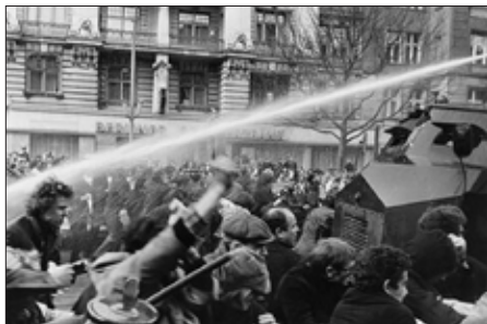
تظاهرکنندگان در اعتراض به سوء قصد به جان دوچکه با پلیس درگیر می‌شوند

با نفوذی نظیر دوچکه را در بر می‌گرفت. ۲۳ نویسندگان این گروه از همکاران پرخواننده کنکرت محسوب می‌شدند. با بالا گرفتن کشمکش‌ها، کلکتیو ناشران اعلام کرد که شرط ادامه کارش با نشریه این است که مقالاتشان امضای کلکتیو را داشته باشد و بدون دستکاری و ویرایش هامبورگ، منتشر شود. این همه خبر از تلاطمات و قطب‌بندی‌ها و جهت‌گیری‌های آینده می‌داد.