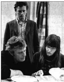
اولریکه ماینهوف در حال کار به روی فیلم بامبوله

می‌داد. بادر و انسلین هم وقتی از زندان فرانکفورت آزاد شدند تصمیم داشتند با بچه‌هایی که از خانه‌های امن فرار کرده بودند و یا از کارآموزی در رفته بودند کار کنند. با کسب اجازه از مقامات فرانکفورت مکانی برای سکونت و جای دادن به جوانان فراری به دست آوردند تا جوانان بتوانند به دست خود و از طریق کلکتیوها برای خودشان زندگی بسازند. جوانان ساکن در بسیاری از پرورشگاه‌ها به اینجا که به نام منطقه‌اش پروژه اشتافل‌برگ* نام گرفت سرازیر شدند. این پروژه تا مدت‌ها ادامه داشت و ارتباطاتی که در این مکان بافته شد، زمینه مناسبی برای عضوگیری راف فراهم آورد. و در اشتافل برگ بود که آشنایی اولریکه با انسلین و بادر به گرمی گرائید.